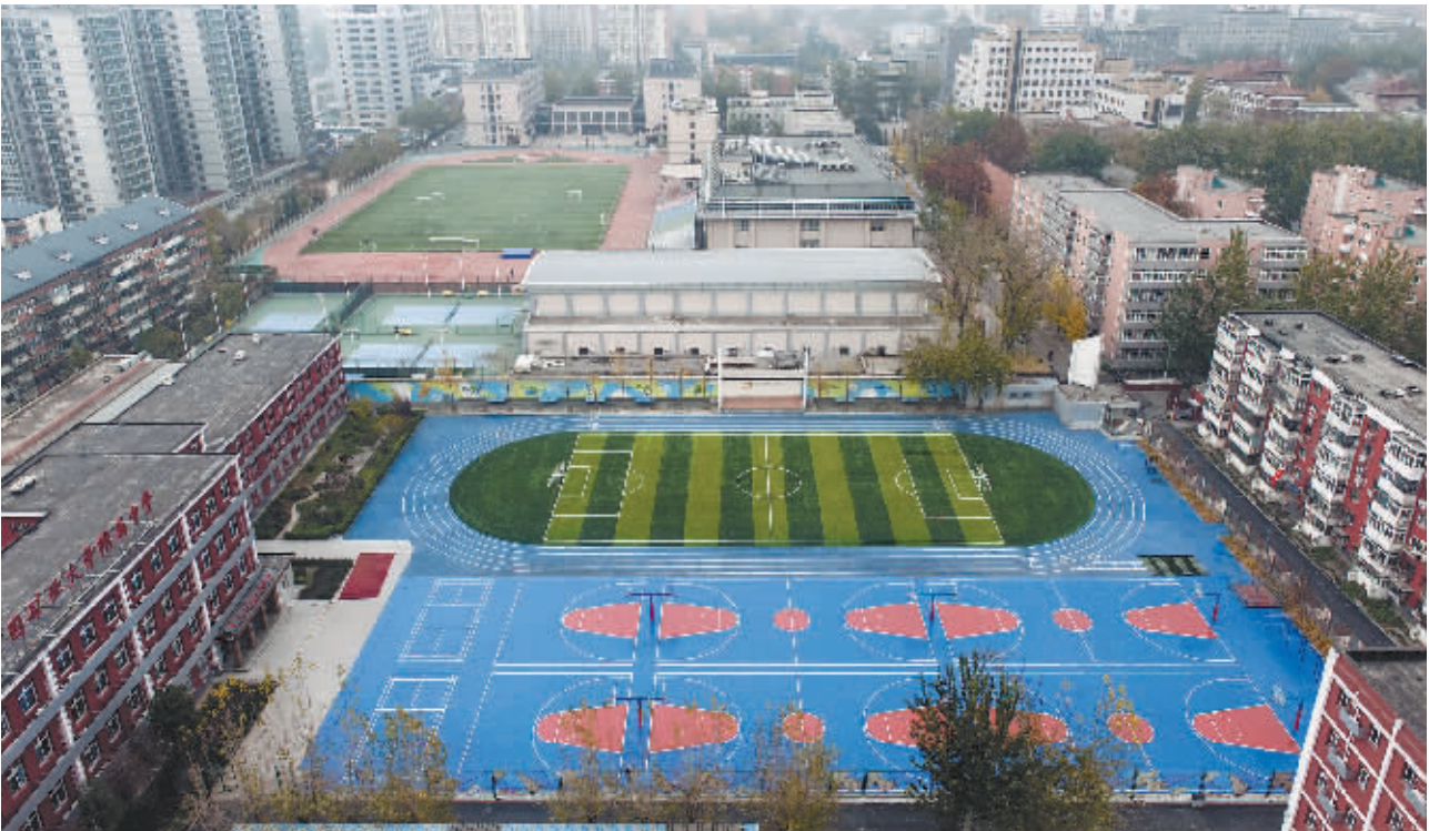
11月18日中午,中国矿业大学(北京)附中的操场上空无一人。该校一位老师称,出于安全和管理等因素考虑,该操场并不向社会公众开放。