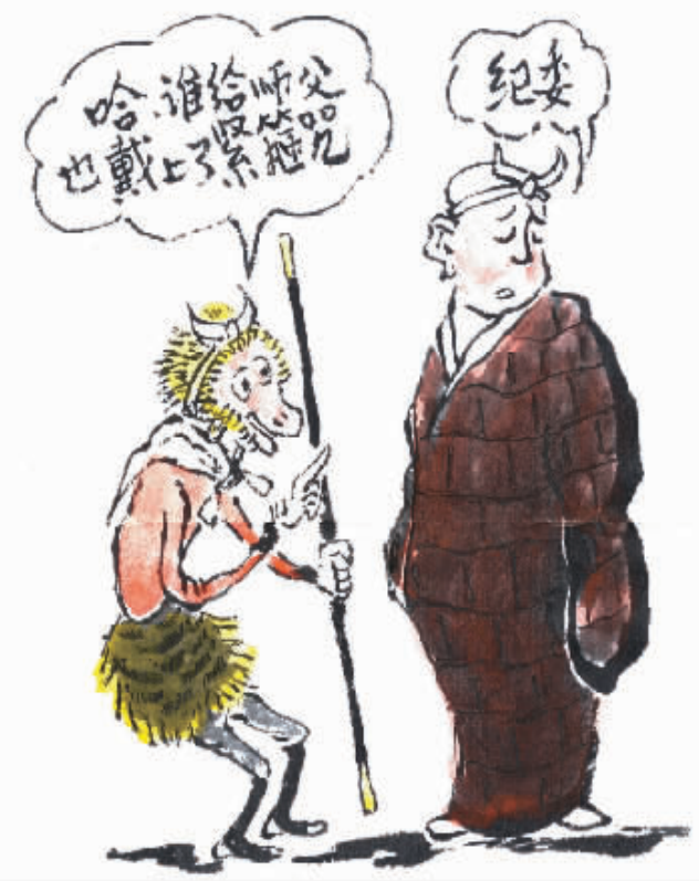
律令面前人人平等