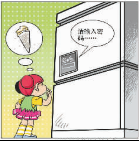
现在的冰箱越来越先进了