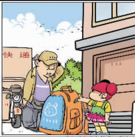
先把我的书包快递到学校