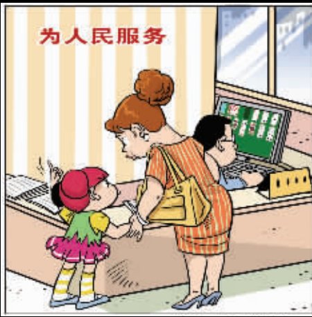
妈妈,上边写的是啥意思?