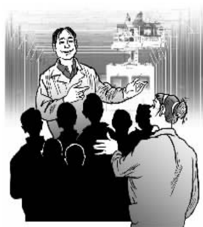
传经授业 互助共进 法明/画

力,也增强了职工的自信心和勇气。很多职工平常只知道埋头工作,不擅长于口头表达,上台演讲不失为是一个很好的“练活”平台。