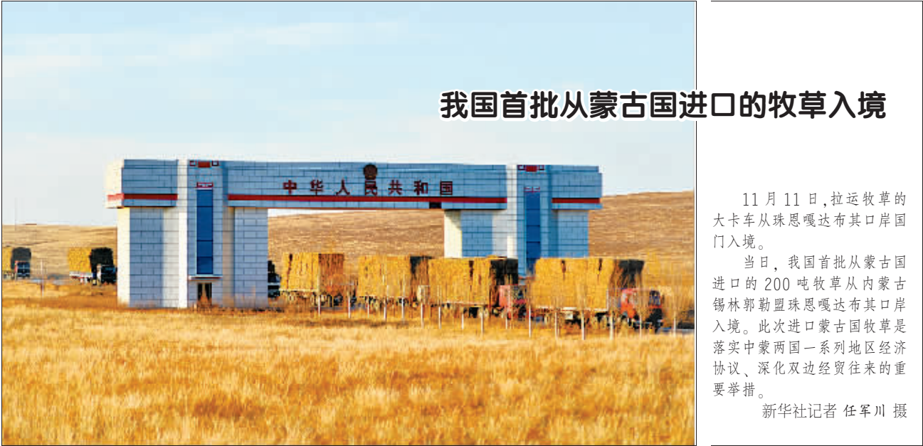
我国首批从蒙古国进口的牧草入境

种种迹象表明，此次金融监管风暴远没有结束。人们相信，随着中央巡视组对包括一行三会在内的21家金融机构专项巡视的展开，会有更多的“成果”值得期待。 目前，市场信心正在恢复，市场和投资者欢迎“监管风暴来得更猛烈一些”。 资本市场的每次动荡，受伤最深的总是中小投资者。随着中国资产证券化规模的日益扩张以及金融创新步伐加快，包括证券期货市场在内的金融市场能否全面深化改革和依法加强监管，建立公平、公正、公开的市场环境，不仅事关投资者权益，更事关市场稳定和金融安全。发生在今年的严重股灾以及随后惊心动魄的“救市运动”，充分证明了这一点。 迟早会到来的“秋后算账”结果十分触目惊心。以程博明为代表的中信证券一千高管在9月因涉嫌内幕交易和泄露内幕消息被公安机关调查；同月，证监会主席助理张育军涉嫌严重违纪被调查；10月，国信证券总裁陈鸿桥自缢身亡……有媒体慨叹，监管层、券商、上市公司、基金……资本市场的核心“玩家”几乎一个不落地出事了。 以“内幕交易”为关键视点，各方勾结联动的全景展现在公众面前——掀开内幕交易的“内幕”，人们看到了深化金融反腐的迫切性和必要性。“内幕交易盛行或屡禁不绝很大程度上与金融腐败严重有关。”经济学家易宪容表示，“如果没有金融腐败的源头，任何内幕交易何以得成？” 党的十八届五中全会公报已经提出要“改革并完善适应现代金融市场发展的金融监管框架”。而“关于制定‘十三五’规划建议的说明”中特别强调，“近来频繁暴露的局部风险特别是近期资本市场的剧烈波动说明，现行监管框架存在着不适应我国金融业发展的体制性矛盾，也再次提醒我们必须通过改革保障金融安全，有效防范系统性风险”。 种种迹象表明，中国金融监管体系改革已经提上了议事日程。