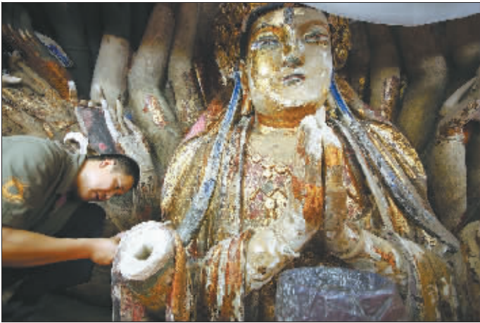
2014年4月18日,重庆市大足区宝顶山千手观音抢救性修复工程现场,工作人员正在修复主尊。

据悉,敦煌石窟与大足石刻举世闻名,是中国石窟艺术的两座丰碑,跻身世界文化遗产之列。敦煌是印度佛教最早传入中国之地,是石窟艺术至高的起点。大足是佛教彻底中国化之地,是中国石窟艺术的句号。本次论坛围绕敦煌学在大足学科建设与发展中的借鉴意义,敦煌与大足两地石窟艺术在推动中国传统文​​化发展中的地位与价值,敦煌与大足两地石窟在打造地方文化产业及提升城市软实力中的作用以及“一带一路”战略框架下大足与敦煌的经济、社会和文化发展进行了全面交流。