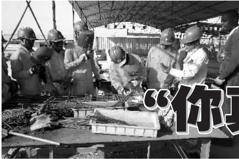
百年职校的安哥拉学生正在学习焊工技术。

根据中国远征军网站资料显示，1942年，为保卫中国西南大后方，滇缅公路和重新打通援华抗战物资“生命线”，中国远征军远赴缅甸对日作战。历时3年零3月，中国投入兵力总计40万人，伤亡接近20万人，其中在缅甸阵亡约10万人。战役结束后，中国远征军将士在缅甸至少建有10个墓地，但后来全部被毁。