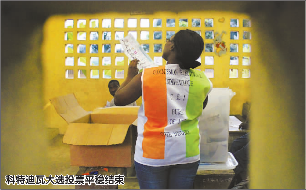
科特迪瓦大选投票平稳结束

法国的行为意味着,叙利亚危机可能进入争夺叙利亚和谈主导权的新阶段。在“四方会谈”结束之后,克里表示下一次会谈最快将于本月 30 日举行,而拉夫罗夫则希望把伊朗、埃及、约旦、卡塔尔和阿联酋等国家都拉进来。在美俄立场并没有靠近的情况下,关于叙利亚问题的和谈更像是美俄相争的另一战场,恐怕很难取得实质进展。