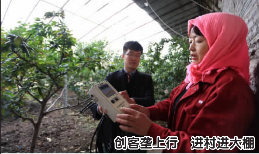
创客垄上行 进村进大棚