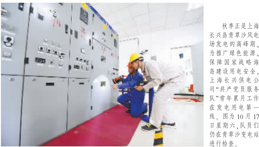
秋季正是上海长兴岛青草沙风电场发电的高峰期,为保障国家战略海岛建设用电安全,上海长兴供电公司“共产党员服务队”常年累月工作在发电用电第一线。图为10月17日星期六,队员们仍在青草沙变电站进行检查。