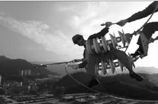
日前,湖北五峰土家族自治县县城整体搬迁进入冲刺阶段。国网五峰供电公司组织职工开展“现场比武、高空接力”技能竞赛标兵评选活动。图为新建 35 千伏户刘线路高空作业现场。