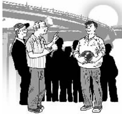
老人感动 青工受益 法明/画

很多。同时有效提升企业的凝聚力、战斗力,让年轻职工更好地承担使命和责任,可谓多赢之举。