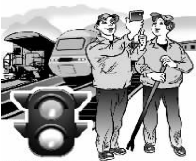
沉到基层 干出实事实明/画

的职工大多分布在偏远地区,干部大老远跑一趟不容易,要准备得当,提升自己,才能不虚此行,成为受欢迎的人。