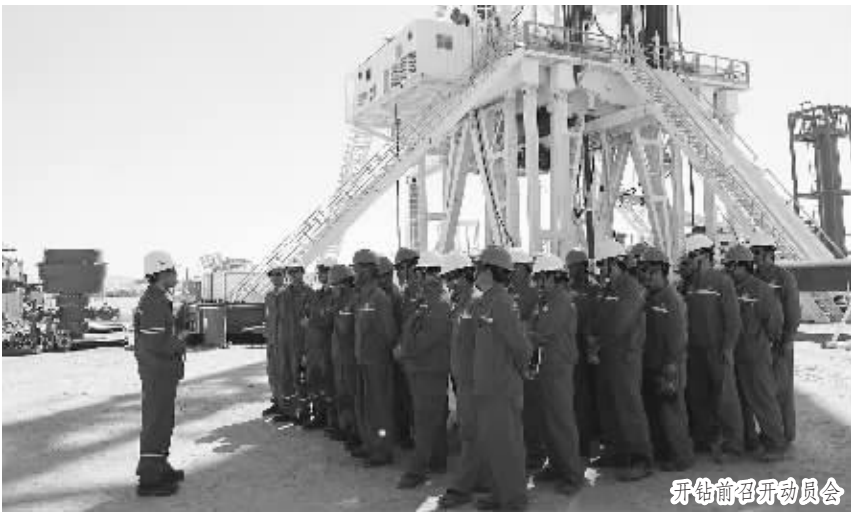
开钻前召开动员会