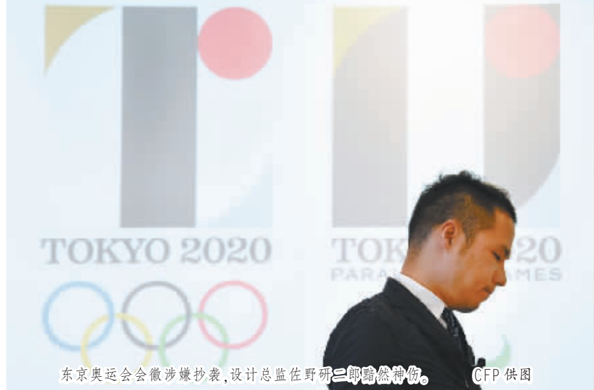
东京奥运会会徽涉嫌抄袭,设计总监佐野研二郎黯然神伤。

各具特色。上世纪80年代以来,随着奥运会商业化的发展,奥运会会徽的设计更趋多元。1988年汉城奥运会会徽由蓝、红、黄3种颜色组成,代表天、地、人“三元一体”的哲学含义;1992年巴塞罗那奥运会会徽更趋抽象,由一点和两个弯曲线条组成的图案代表着巴塞罗那悠久的历史,也表现出巴塞罗那人正张开双臂迎接来自各大洲客人…… 然而,从2012年伦敦奥运会开始,被视为奥运会最权威形象标志的奥运会会徽屡屡传出负面新闻。2007年6月公布的伦敦奥运会会徽被“2012”拆解成“20”和“12”上下组合而成,几乎没有任何象征“伦敦”和“英国”的