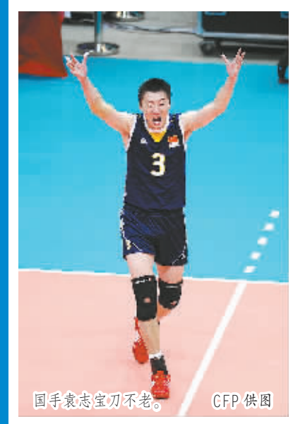
国手袁志宝刀不老。

世界杯举办权可会易主? 和之前的每一次国际足联动荡一样,俄罗斯方面对布拉特、普拉蒂尼和瓦尔克被“禁足”作出的第一反应是,“什么都不能影响2018年世界杯足球赛将在俄罗斯举办这一既定事实”。 从2018和2022年世界杯举办权分别授予俄罗斯和卡塔尔的那一刻起,关于申办过程是否存在贿选的争论就没停止过;操心自己能否获得第五个国际足联主席任期之前,布拉特已经为之头痛了两年之久。 美国主导这次司法行动的动机当然有针对2022年卡塔尔世界杯主办权的方面,不过在图谋这块赛事、赞助到电视转播权都蕴含巨大利润的商业蛋糕之余,曾被称作足球荒漠的美国还觊觎着扩大其对世界足坛整体版图的控制权。 英格兰则明显还对当年与俄罗斯竞争2018年世界杯举办权时只得到两票的奇耻大辱耿耿在心,因此对美国联合瑞士的司法行动表现得最支持,每次发声回应也最是积极。 尽管体育史上因丑闻而由外力作用取消东道主办权的先例根本为零,俄罗斯和卡塔尔对各自世界杯也已是该建设的建设,该投入的投入,但针对国际足联贪腐的调查仍在进行中,布拉特的倒台并不意味着与利的争夺戛然而止,反而有可能掀起新一轮的血雨腥风。 “倒布”行动成功了,谁知出完一口气的某些势力会不会真要把调羹伸向俄罗斯和卡塔尔的盘中呢。