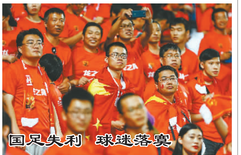
国足失利 球迷落寞

2016年里约奥运会会徽于2011年出炉,当即被指在设计上与美国一家慈善公益机构的徽雷同。里约奥运会会徽设计团队塔