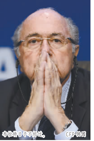
命他日子不好过。

北京时间10月3日,在英超联赛第8轮曼城主场对阵纽卡斯尔的比赛,曼城球员阿圭罗20分钟内独中五元,帮助球队以6比1大胜对手的同时,也成为英超历史上第5位在一场比赛中攻入5球的球员,其他四人是安迪·科尔、希勒、迪福和贝巴托夫。