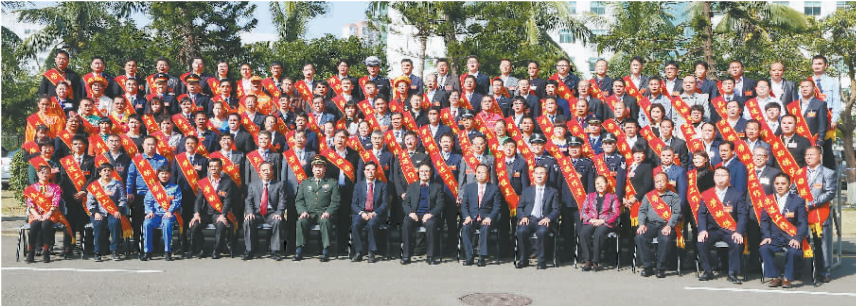
来自海口市各行各业的劳动模范参加2015年海南省第六次劳动模范和先进工作者表彰大会

如今，劳模精神这股正能量，随着海口各级工会劳模宣传工作的不断创新推进，正激励着海口广大职工和劳动群众向海口后发赶超、同步小康的幸福征程迈进。