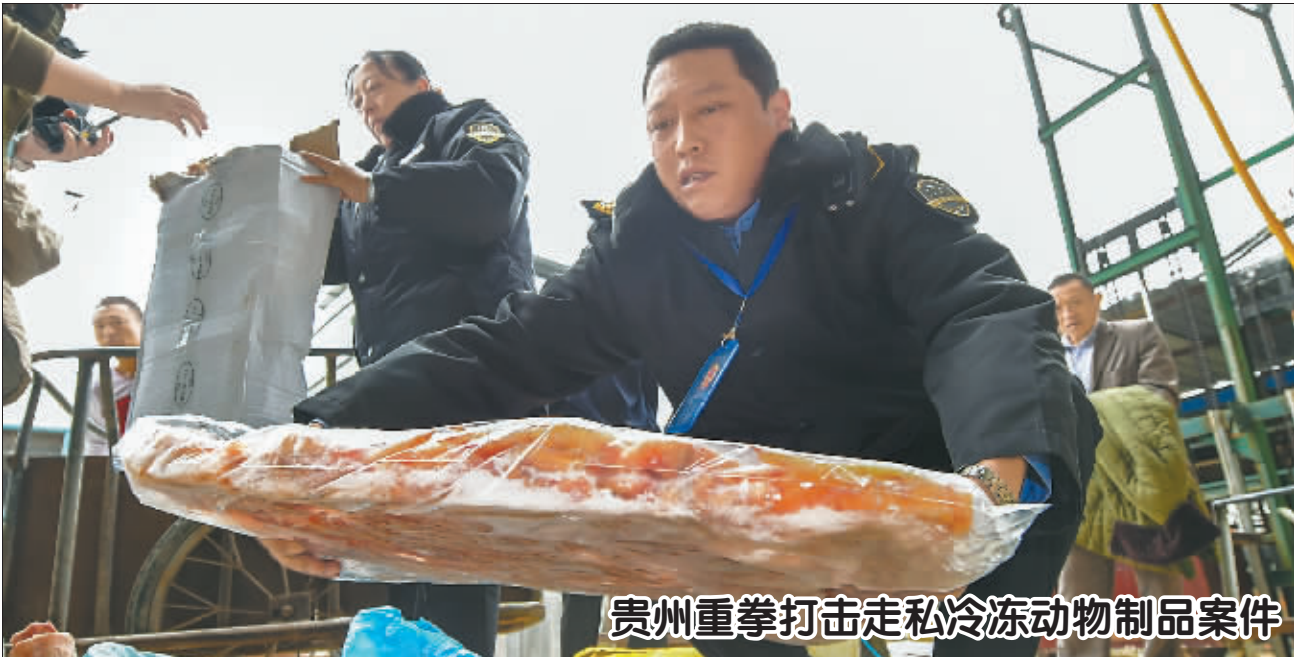
贵州重拳打击走私冷冻动物制品案件

9月14日,贵州省食品药品监督管理局工作人员清点查获的走私冷冻动物制品。2015年7月至今,贵州省查处多起涉嫌走私冷冻动物制品案件,涉案货物约710余吨,货值金额约2300多万元。目前涉案货物被依法扣押或查封,部分涉案货物已被集中销毁。