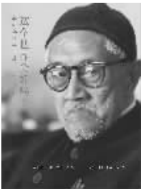
梁漱溟 【美】艾恺著 生活·读书·新知三联书店

本书是美国芝加哥大学历史系教授艾恺在写作《最后的儒家——梁漱溟与中国现代化的两难》后,为印证事实,订正该书未尽正确、周详之处,于1980年8月特来华专访梁漱溟先生,长谈十余次的访谈记录。谈话中,梁氏论述了儒家、佛家、道家的文化特点及代表人物,还谈及与诸多政治文化名人的交往经历,并回顾了他人生的重要活动——任教北大、从事乡建运动、创建民主同盟等。书中内容丰富,可作为了解与研究梁漱溟思想与活动及近代中国社会生活的重要参考。本版仅订正错讹,还增加了艾恺教授为新版所作的序言,并增补了若干珍贵插图和注释。