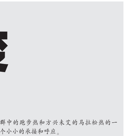
群中的跑步热和方兴未艾的马拉松热的一个小小的承接和呼应。

如何有效遏制这种“换个马甲”式天价中秋礼品回潮现象？关键还是要以“作风建设永远在路上”的态度，不断深入巩固落实中央八项规定和反“四风”成果。一方面，面对各种改头换面的“四风”新马甲、新花样，要继续保持反“四风”高压态势，真正让敢于我行我素者付出代价；另一方面，还要不断推动反“四风”长效机制体制建设，促进作风建设的规范化、制度化、法治化。