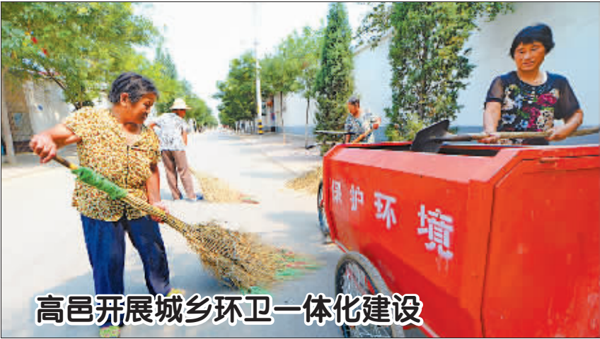
高邑开展城乡环卫一体化建设

8 月 26 日,河北高邑仓房村的卫生保洁员在清扫街道。 近年来,河北高邑县按照“户分类、村收集、公司运转处理”的模式进行城乡环卫一体化建设,通过与环保企业合作,统一将县城、农村的垃圾运往垃圾填埋场处理,实现垃圾日产日清。