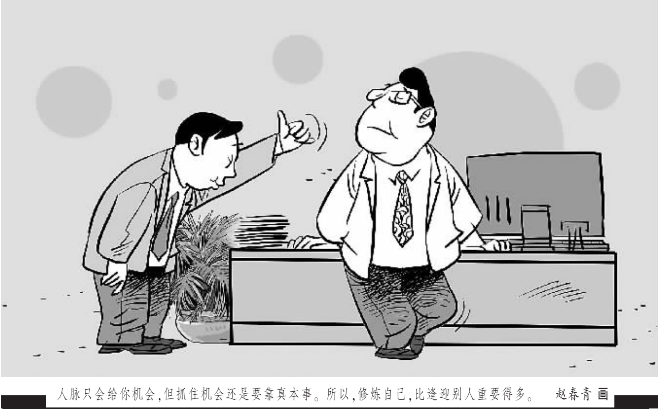
人脉只会给你机会,但抓住机会还是要靠真本事。所以,修炼自己,比逢迎别人重要得多。 赵春青 画

据介绍,对IP的饥渴,使得网络文学在这几年来炙手可热。因为利用成熟的网络IP开发产品可以缩短产品周期,并可引入网络文学的大量用户。比如游戏产业,在2014年就已经进入千亿市场,高强度竞争背后,IP