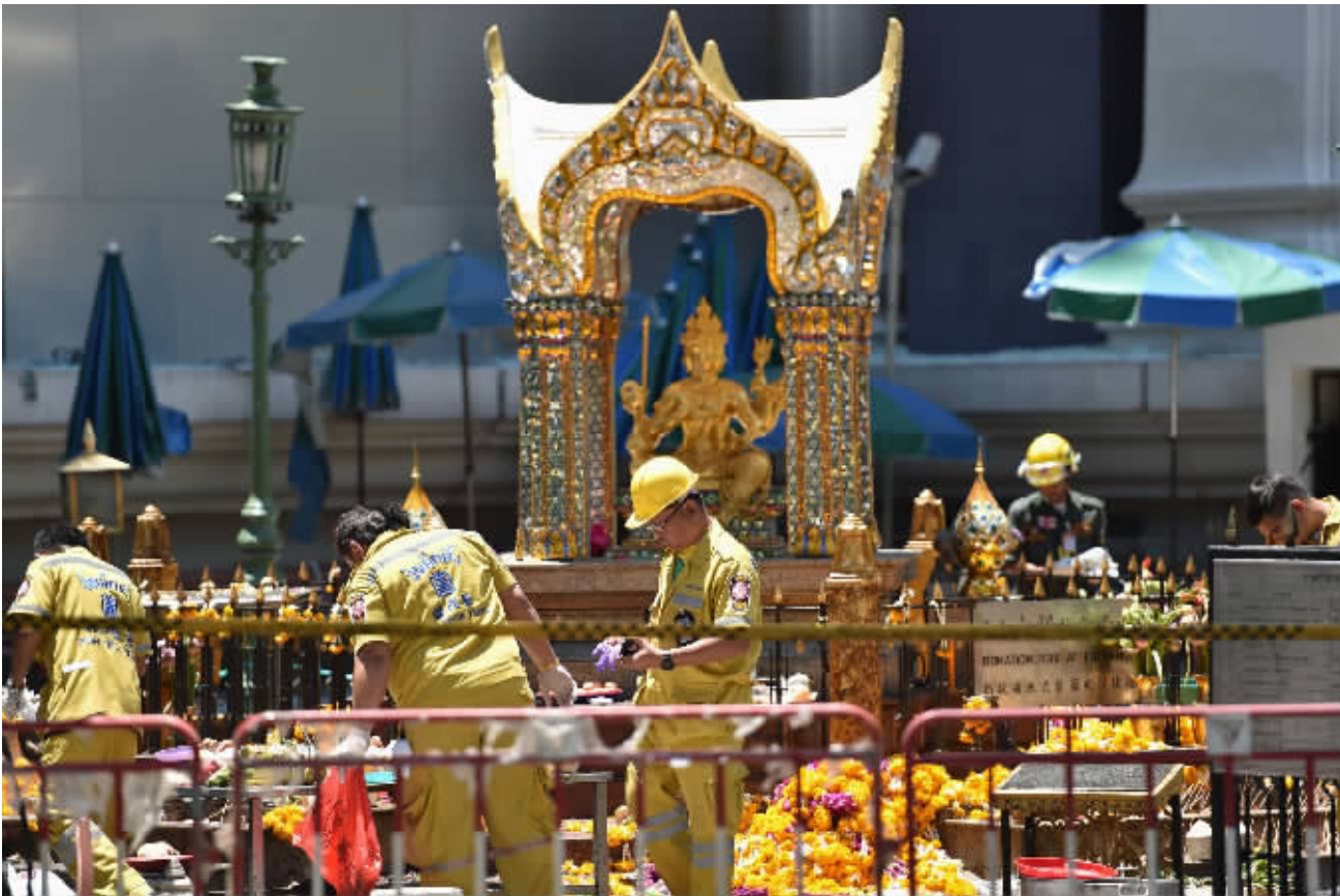
8月18日,救援人员在泰国曼谷的爆炸现场进行清理。

炸中的遇难者,泰国政府将提供每人一次性约30万泰铢(约合5.38万元人民币)的赔偿,泰国司法部对外籍遇难者家属一次性补偿4万泰铢(约合7180元人民币);对于受伤者,将提供每人10万泰铢(约合1.79万元人民币)医疗费,2万泰铢(约合3600元人民币)精神损失费,误工费(一天200泰铢,最高一年),其他损失费3万泰铢(约合5400元人民币)。医疗费如果超过10万泰铢,则由卫生部负责剩余部分费用。