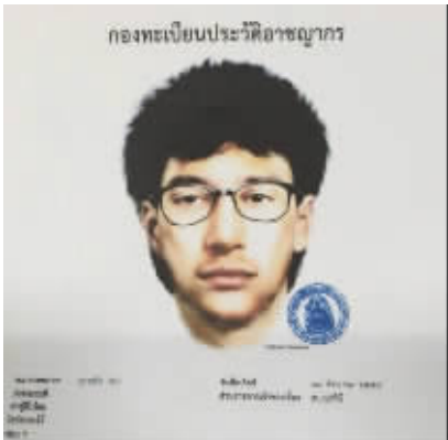
曼谷爆炸案作案嫌疑人模拟画像