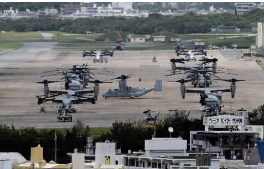
美军在普天间机场目前部署有24架“鱼鹰”运输机。

除了这些具体因素之外,普天间机场搬迁问题的根本症结还在于日本政府和冲绳县对普天间机场的认识不同。日本政府和自民党外交政策的基础是日美同盟,驻日美军被看作是日本的安全保障,因此日本政府会不惜牺牲国民利益来讨好美军。冲绳县则认为