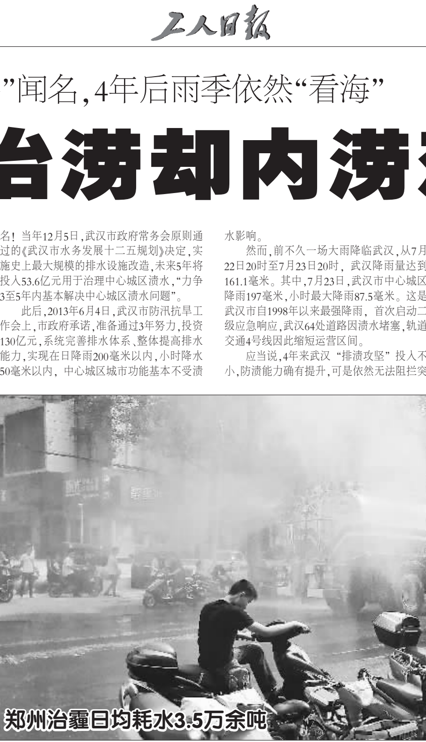
郑州治霾日均耗水3.5万余吨

助银行将传统银行服务模式和科技创新产品有机结合，用户无需人工帮助就可以在自助银行办理业务咨询、开卡挂失、投资理财、存取款等多种金融业务。