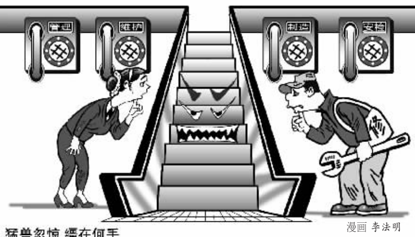
猛兽忽惊 缰在何手