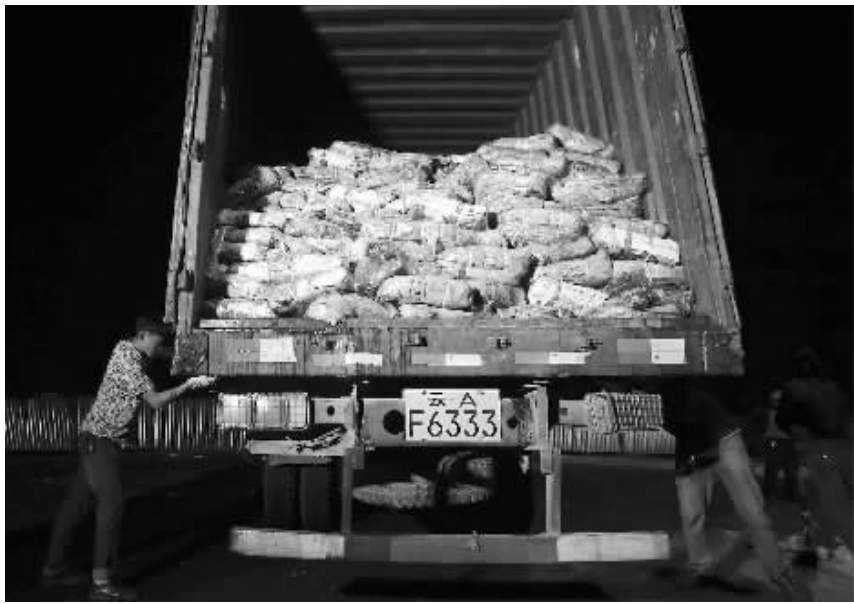
2015年7月15日,昆明集中销毁了近600吨瘦肉。