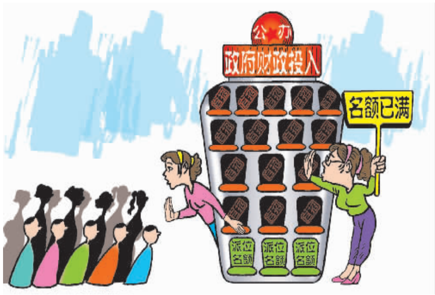
公办资源 何以“私”用?

同时,地方政府加大了对中职教育的投入和支持力度。以十堰为例,连续4年,市政府每年划拨100万元专项经费,组织举办全市中职技能大赛,并建设特色专业、示范校,组建区域职业教育集团,调整优化专业设置,学生就业率连续四年保持在96%以上。该市还在各中职学校之间实行联校协作,统一教学和备考,本、专科上线率逐年提升。这样的高升学率和高就业率,自然引来学生青睐。