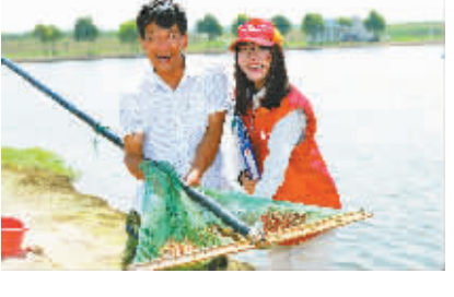
户该如何预防风险,以及有效应对措施,和抢险值班的联系方式。

这张标题为“如何确保您的水产养殖可靠用电”的宣传册里,插入了4幅由公司青年自发创作的图文漫画,简洁明了地告知养殖