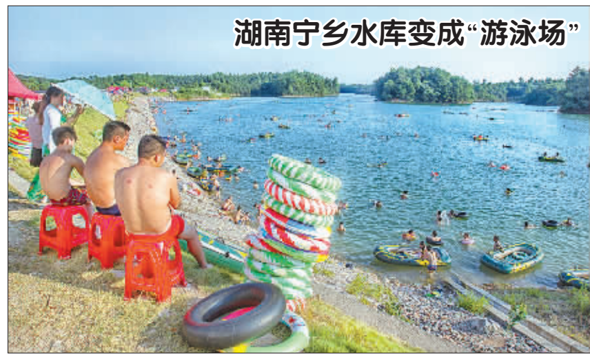
湖南宁乡水库变成“游泳场” 8月2日,天蓝水清。水库入口处,不足3米宽的路上停满了汽车和摩托车。水面上百人已在水中游泳。 这里其实是湖南省长沙市宁乡县的白

“我们成立之初,公司注册资本仅为280万元,主要从事指纹锁的生产与销售。”7月29日,管延成对《工人日报》记者说,“经过十余年的经营,现在公司产品已涉及智能家居技术领域的各个方面,2014年销售额达6000余万元。这一路走来,着实不易。没有苦干,哪有今天?”