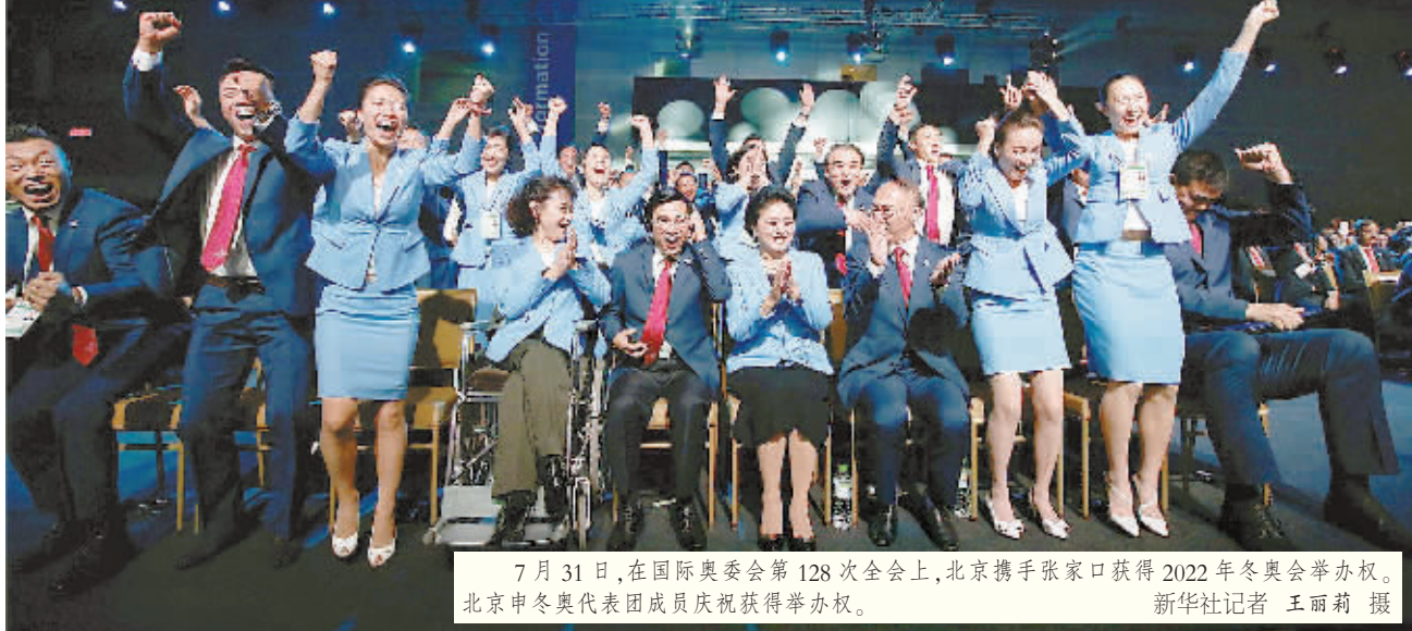
7月31日，在国际奥委会第128次全会上，北京携手张家口获得2022年冬奥会举办权。北京申冬奥代表团成员庆祝获得举办权。