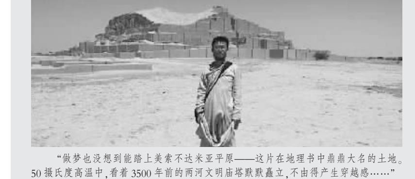
“做梦也没想到能踏上美索不达米亚平原——这片在地理书中鼎鼎大名的土地。50摄氏度高温中，看着3500年前的两河文明庙塔默默矗立，不由得产生穿越感……”