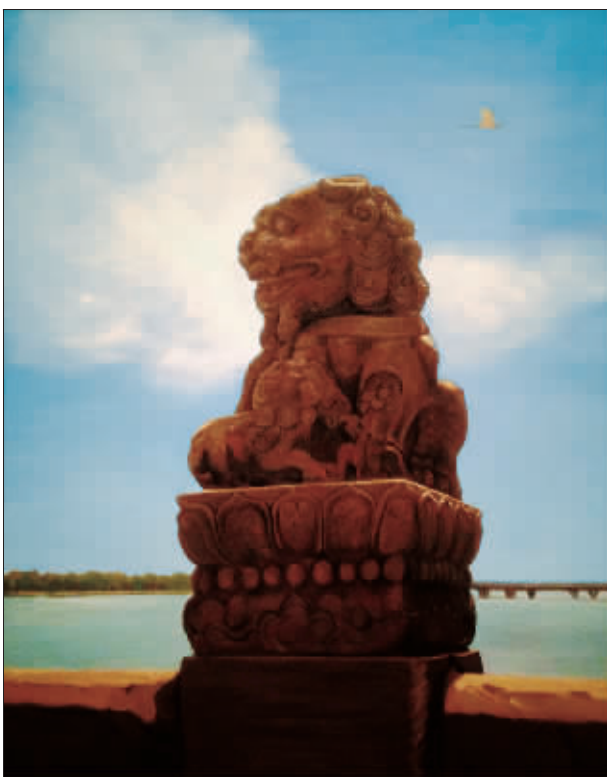
历史的记忆——卢沟醒狮 (油画) 林笑初