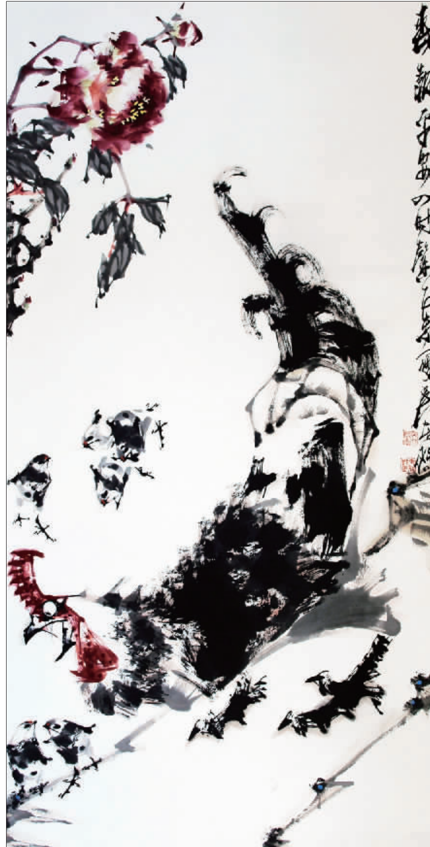
喜报平安四时馨 (国画) 吴东魁