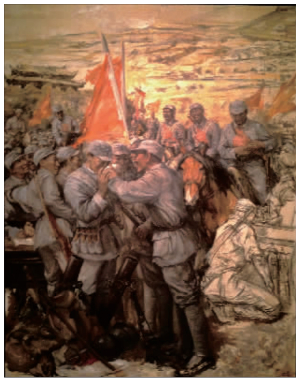
荡尽敌寇凯歌还 (油画) 王晓伟