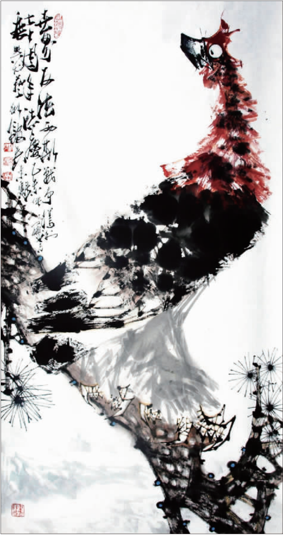
雄起东方 (国画) 吴东魁 为纪念世界反法西斯战争胜利 70 周年创作