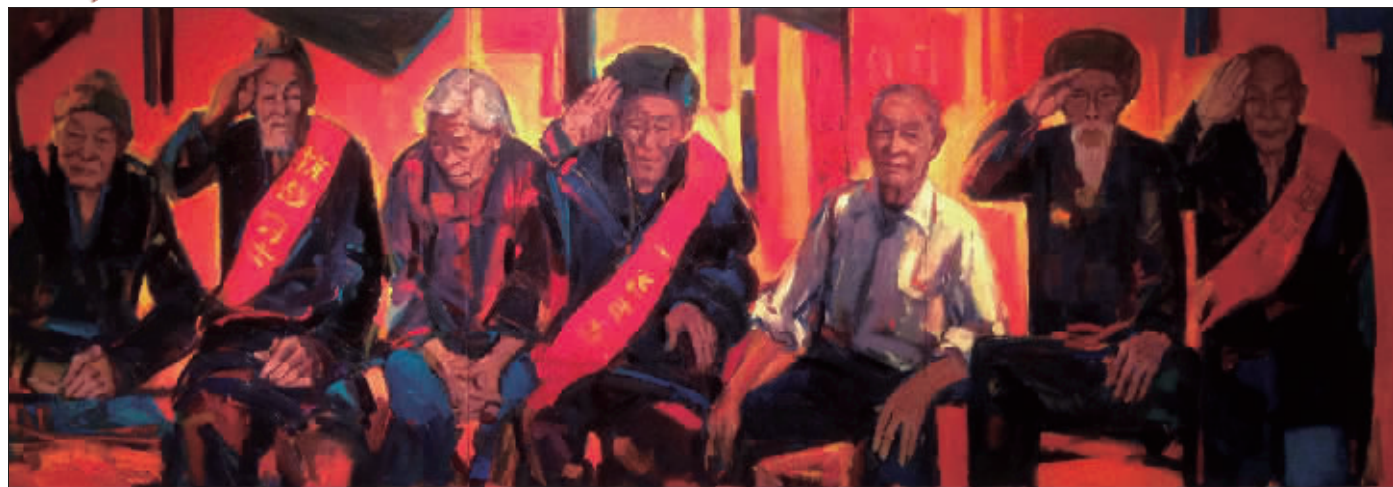
远征军老兵 (油画) 石煜