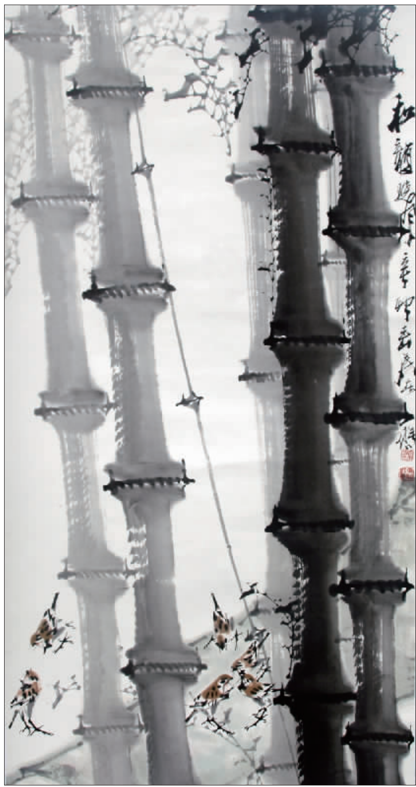
和韵晓风 (国画) 吴东魁

骨,而且是一位有着馨德柔情的慈善画家。将艺术所成无私地回馈社会,一直以来是他的理念和实践准则。画家以“雄健苍挺 侠骨柔情”的真性情,不断创作并捐赠。发誓并践行着“活到老、画到老、捐到老,在有生之年捐建100所希望小学”的夙愿。(木子)