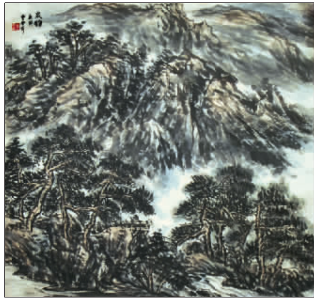
泉韵 (国画) 曹雪芹