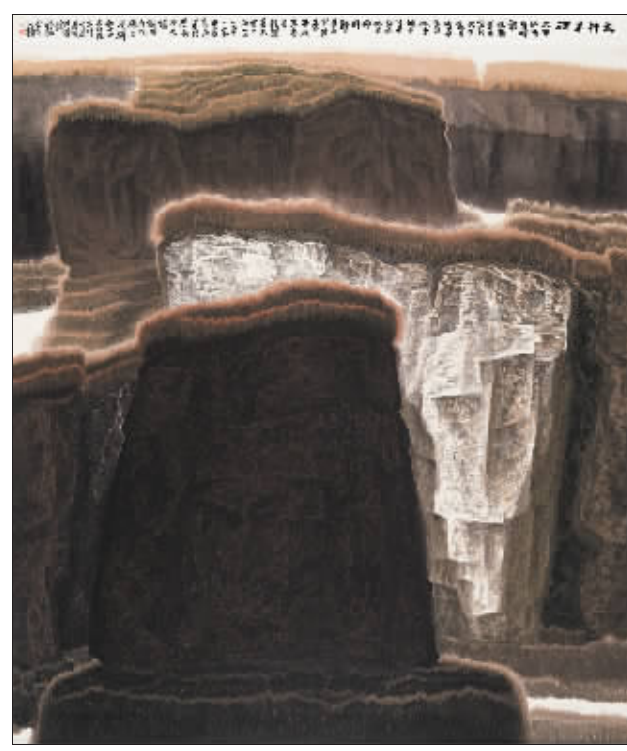
太行丰碑 (国画) 贾又福