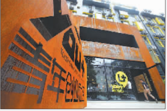
充满青春活力的创业社区。

30年,对于投资规模大、回报周期长的高速公路,可以约定超过30年的特许经营期限。 修订稿相应提高了收费公路设置门槛,明确新建和改建技术等级为二级以下(含二级)的公路不得收费;已经取消收费的二级公路升级改造为一级公路的,不得重新收费。独立收费桥隧的设置标准,提高为1000米以上。交通运输部规划司副司长任锦雄称,“收费公路仅占全国公路里程的3%,未来,97%的公路不收费。”