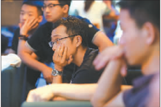
聆听别人的创业故事。