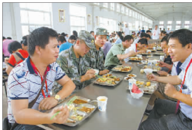
来自广西的劳模代表和军营战士们一起吃午饭。