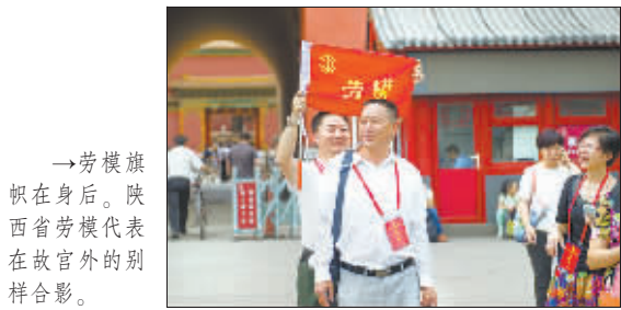
→劳模旗帜在身后。陕西省劳模代表在故宫外的别样合影。