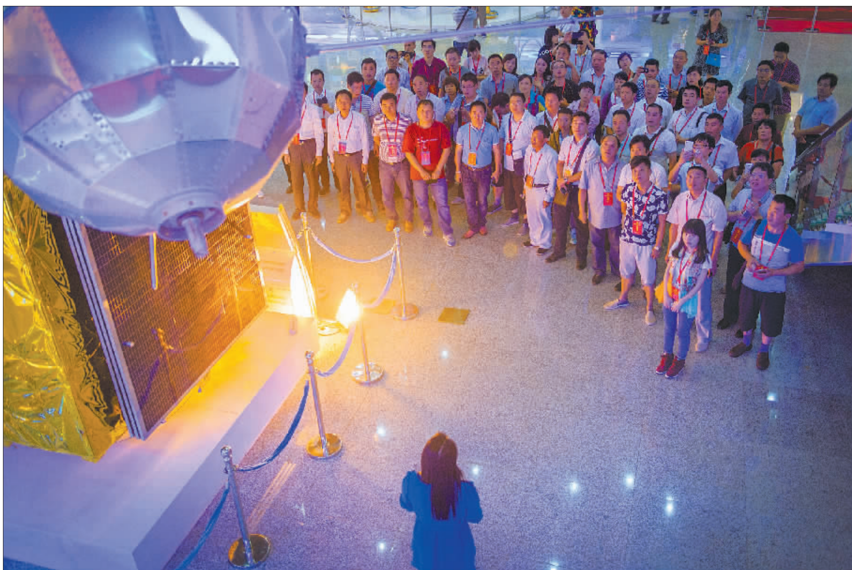
劳模代表们在航天城现场听工作人员讲解中国航天事业的发展历程,图为中国第一颗人造卫星“东方红一号”模型。