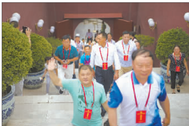
大部分劳模代表是第一次登上天安门城楼。