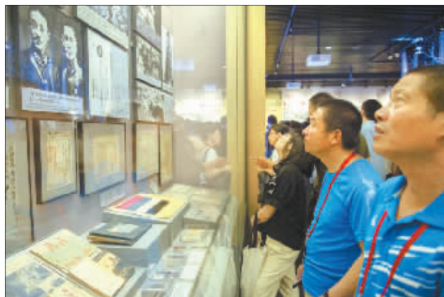
在抗日战争纪念馆,劳模代表们在国民革命军第十九路军总指挥蒋光鼐和军长蔡廷锴肖像前停下脚步。