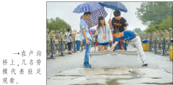
→在卢沟桥上,几名劳模代表驻足观看。