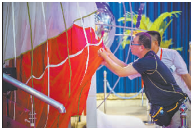
航天城里,航天降落伞布的材质唤起了劳模代表的好奇心。