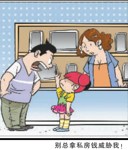
别总拿私房钱威胁我!