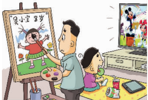
孩子要参加绘画大赛