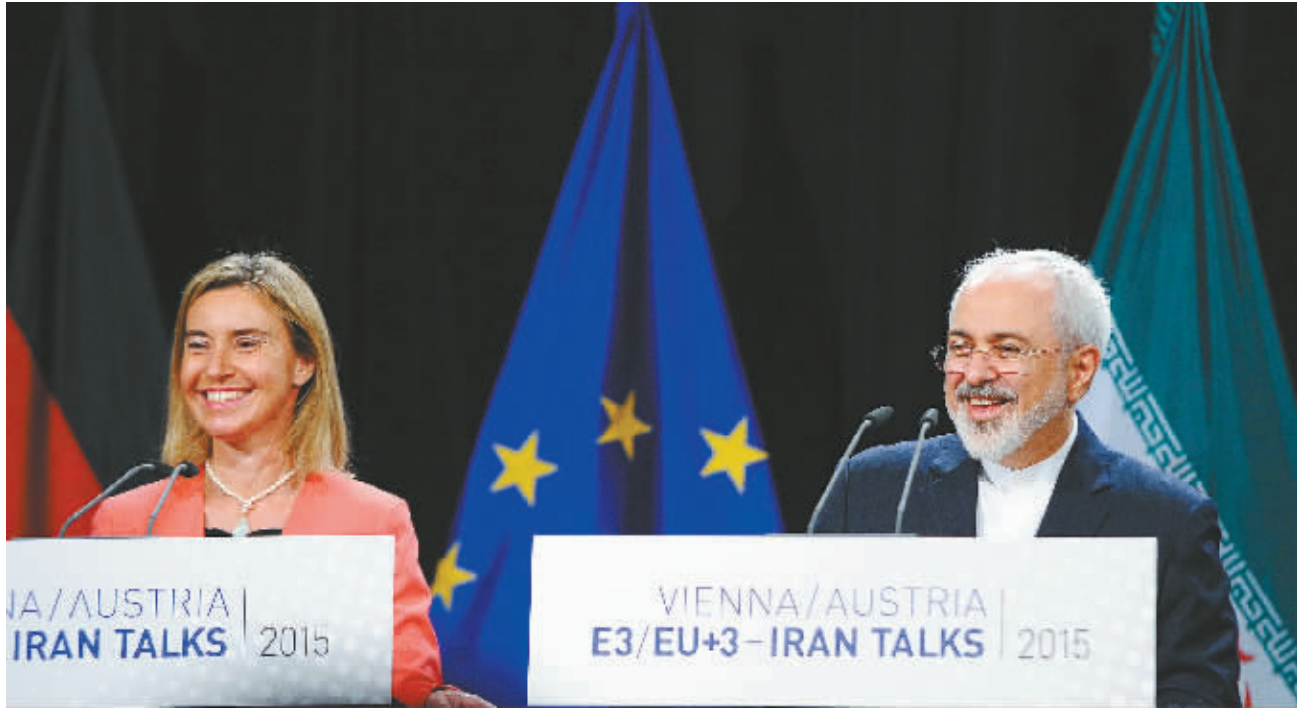
7 月 14 日,在奥地利维也纳,欧盟外交和安全政策高级代表莫盖里尼和伊朗外长扎里夫在新闻发布会上宣读共同声明。

中国外交部部长王毅在全面协议达成后表示,中国作为安理会常任理事国,意识到对国际和平与安全承担的责任和义务,始终以建设性姿态参与了伊核谈判全过程。中国并不是矛盾焦点,这可以使中方以更为公正、客观的立场积极开展斡旋。特别是在谈判的一些重要节点,包括谈判遇到困难、陷入僵局时,中方总是从各方共同利益出发,积极寻求解决问题的思路和途径,提出中国的方案,可以说,中国发挥了独特的建设性作用,得到各方高度赞赏和肯定。下一步,伊核全面协议的落实仍有许多事情要做。中方将继续以负责任的态度,为此做出中方新的贡献。