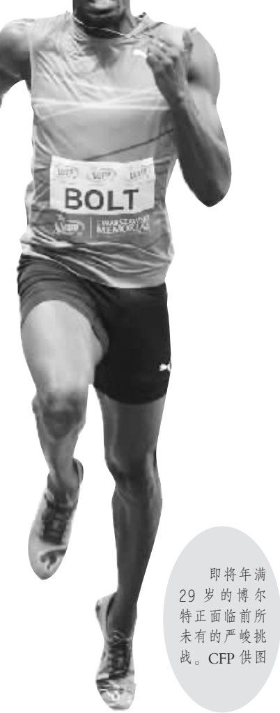
即将年满29岁的博尔特正面临前所未有的严峻挑战。

喜欢他的人感到失望。因为伤病,博尔特本赛季一共只出战了5场比赛,其中100米只跑了1次,成绩是10.12秒;200米跑了3次,最好成绩只有20.13秒。在这两个主项上,博尔特的巅峰时期的成绩相比差距不小。在博尔特的备战计划中,他希望能从6月到7月间参加牙买加全国锦标赛以及钻石联赛,通过和强手们的较量寻找状态,可惜伤病的再次袭来让计划落空。