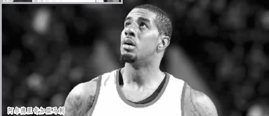
阿尔德里奇加盟马刺