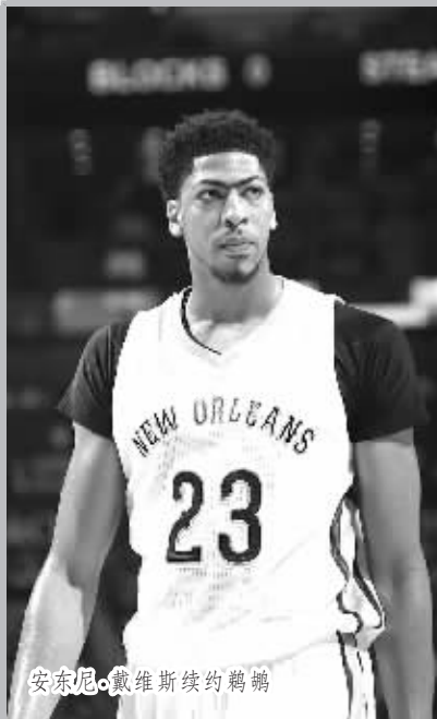
安东尼·戴维斯续约鹈鹕