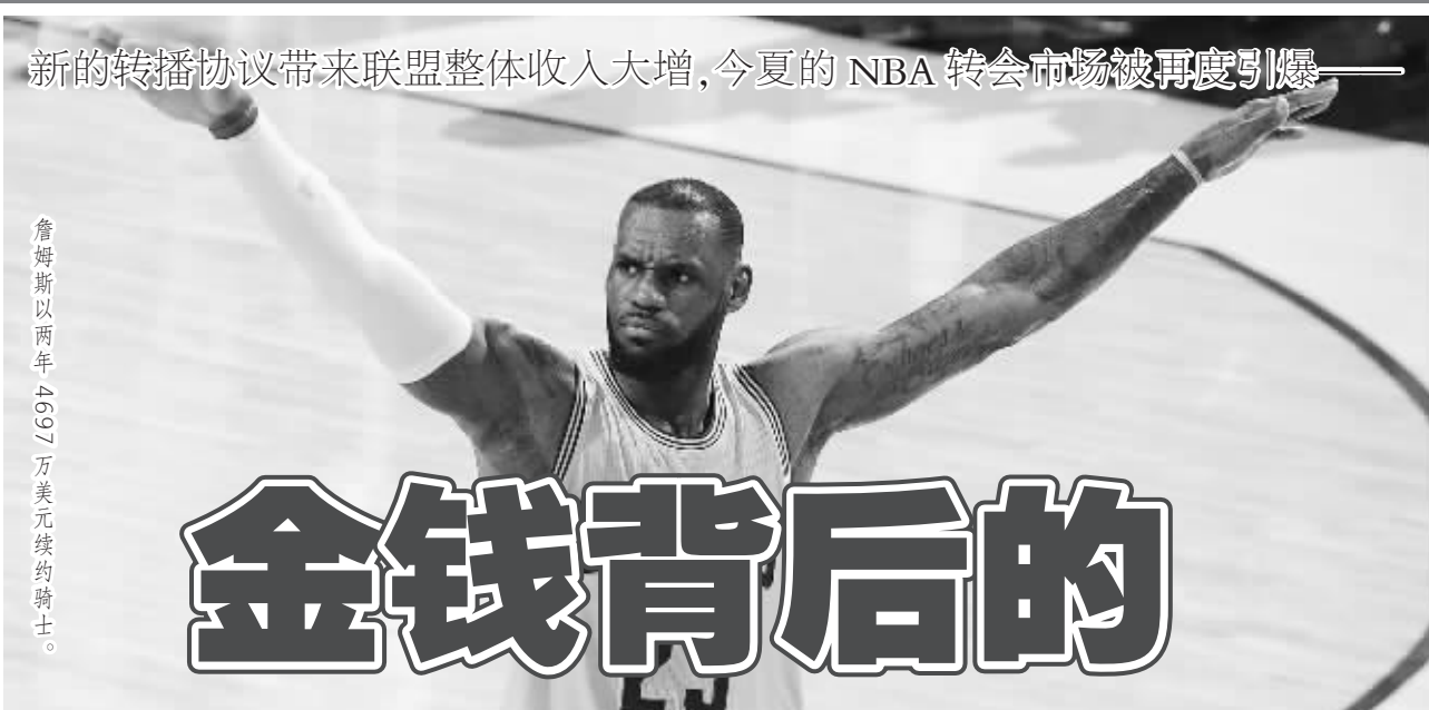
詹姆斯以两年4697万美元续约骑士。