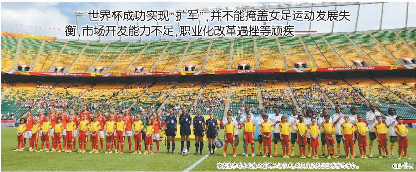
喀麦隆和瑞士比赛之前的入场仪式,球员身后是空空荡荡的看台。

欧洲人玩起了奥运会,对于中国体育也是一种有力的启示:在体育发展的道路上,敢于拿来,善于学习非常重要,但坚持特色、发扬优势同样重要,这也是一种文化自信。比如举国体制,事实证明非常适合中国国情,许多国家学习都来不及,我们又何必妄自尊大,急于否定自我?服务于奥运战略的举国体制,和职业体育某些方面会有冲突,但二者并非天敌,我们完全可以在二者之间找到平衡。体育和许多文化现象一样,参差多态,互相融合才能向前发展。对于当下的世界体育发展来说,欧美中心主义或已成为过去,和而不同,美美与共可能会成为常态。这难道不是一件很美妙的事情吗?