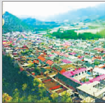
盖成彩钢房的传统村落

据北京晚报 在“关于加强北京市传统村落保护议案”办理情况座谈会上,有北京市政协委员反映,该市的一些传统村落,村民将房屋盖成了彩钢房,村内涌入流动人口,传统风貌被破坏。 相关负责人坦承,由于没有相关政策的约束与支持,村民建房自主性大,如果村民按照古建筑建造,造价至少比现在的房子贵一倍,自然选择建造现代房屋。