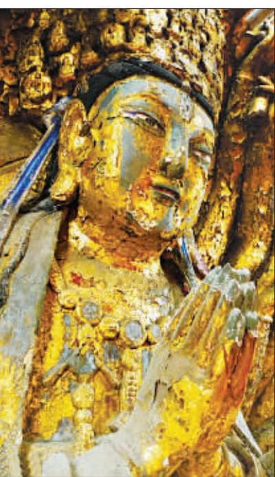
重庆大足石刻千手观音造像修复前

改变这一情况,应当在完善基础设施、改善居住环境的同时,对传统村落的村居建设进行相应规范,并通过“一村一策”的方式,探索适合传统村落,特别是山区传统村落的发展模式。