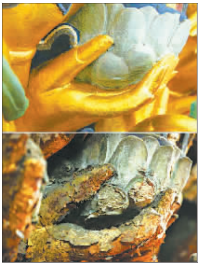
千手观音造像手与莲台修复前后对比图