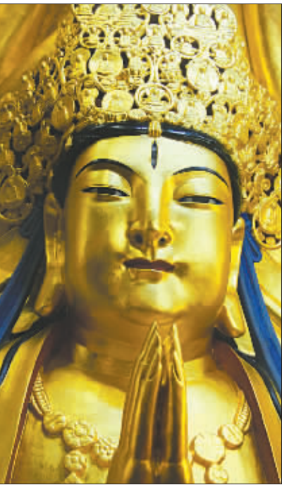
重庆大足石刻千手观音造像修复后