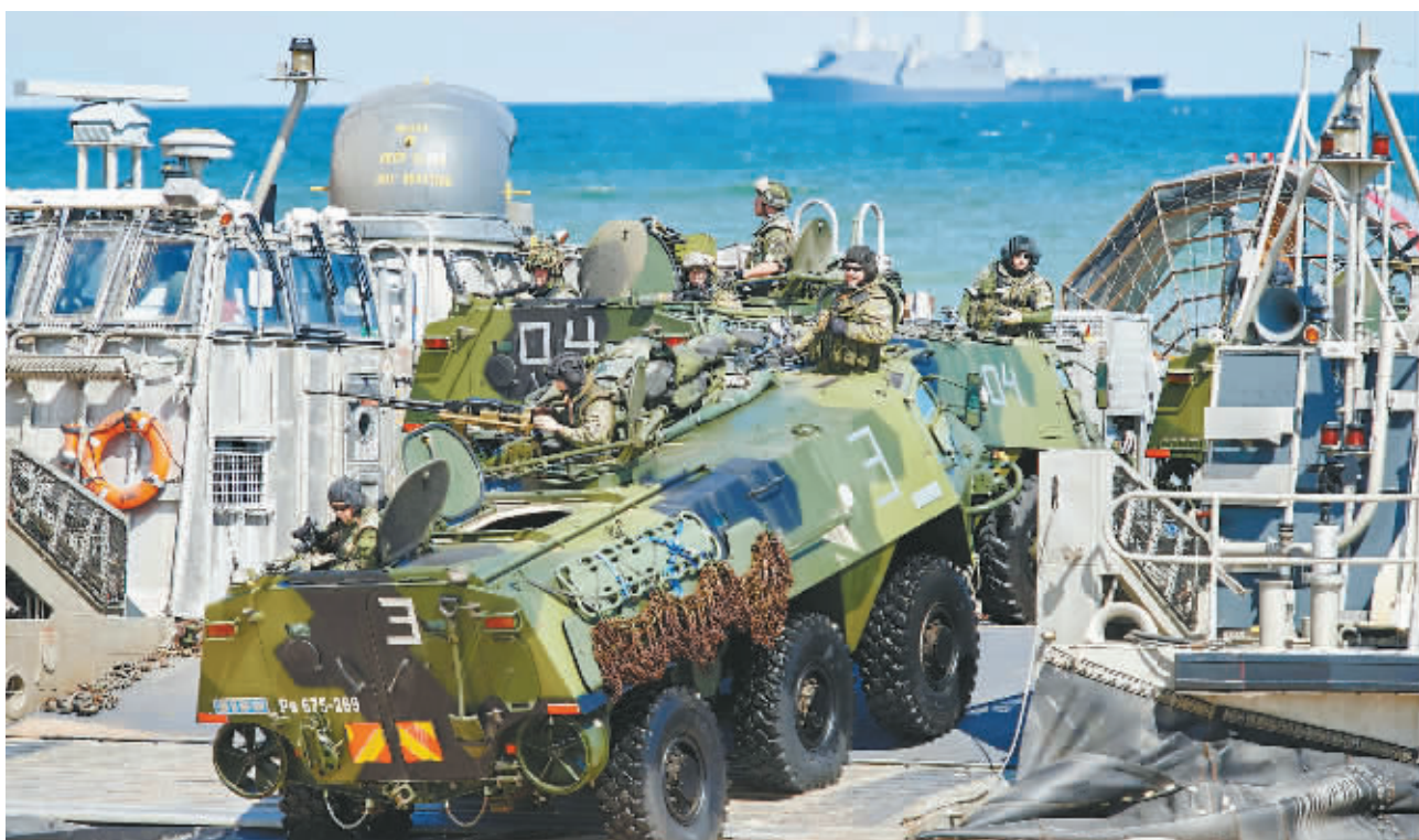
6月17日，波兰兰特卡，北约成员国及其伙伴国的部队在波罗的海沿岸进行登陆演习。

意大利为欧盟全体均有责任分担大量难民，各国“自扫门前雪”的做法招致意大利的不满。法国内政部长卡泽纳夫此前声称，法意边境完全没有封锁，法国一直遵守欧盟的义务。意大利总理伦齐15日则不点名地回击