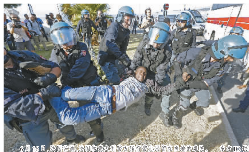
6月16日，法国边境，法国和意大利警方押解滞留当地的难民。

作为反对配额制的头号国家，英国内政大臣特雷莎·梅当天也再次重申了英国的强硬态度，称欧盟应当果断遣返所有偷渡至欧洲的移民，而非采取难民安置的政策。据悉，今年已有超过5.7万名移民和避难者在海上被救起并带到意大利，比去年同期的5.4万人还多。围绕非法移民问题，意大利与欧洲其他国家还需弥合分歧妥善处理。