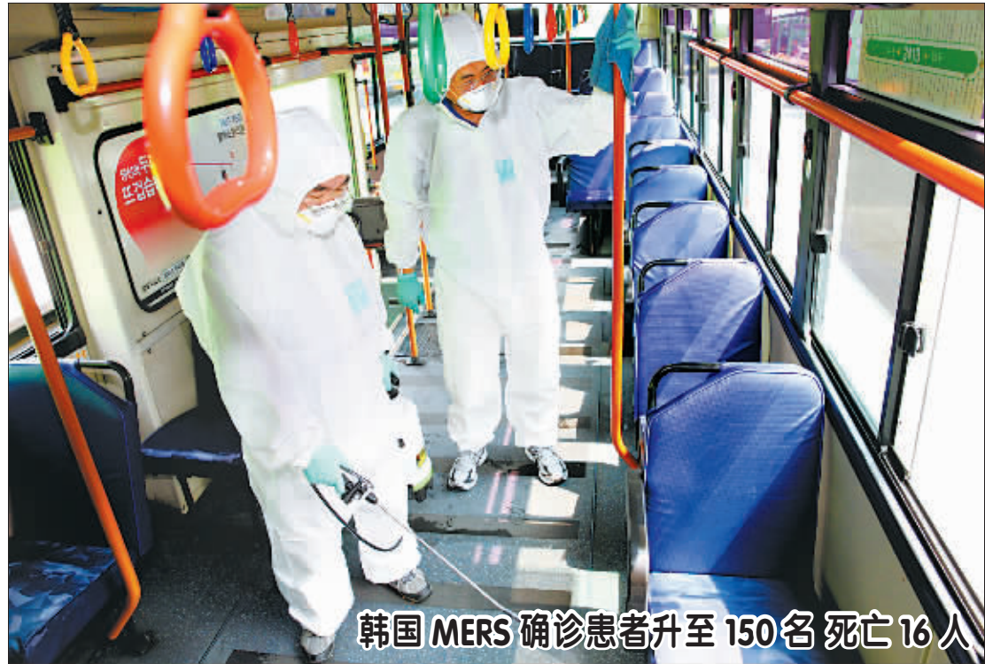
韩国 MERS 确诊患者升至 150 名 死亡 16 人

国际刑事法院是根据《罗马公约》设立的永久性国际刑事裁判机构,于2002年7月在荷兰海牙开始运作。