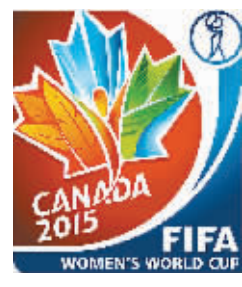
女足世界杯特别报道⑥