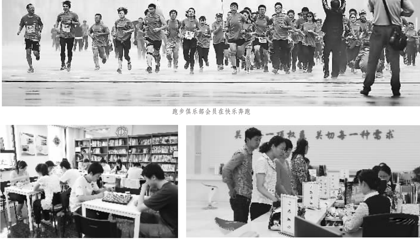
员工小剧团精彩节目(千年琵琶)