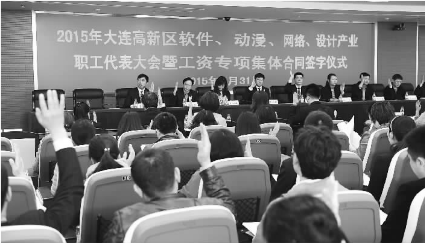
高新区2015工资协商——四个产业联合会

工会干部队伍是工会组织的骨干力量,他们特别能吃苦能战斗,为工会事业的发展做出了重要贡献。