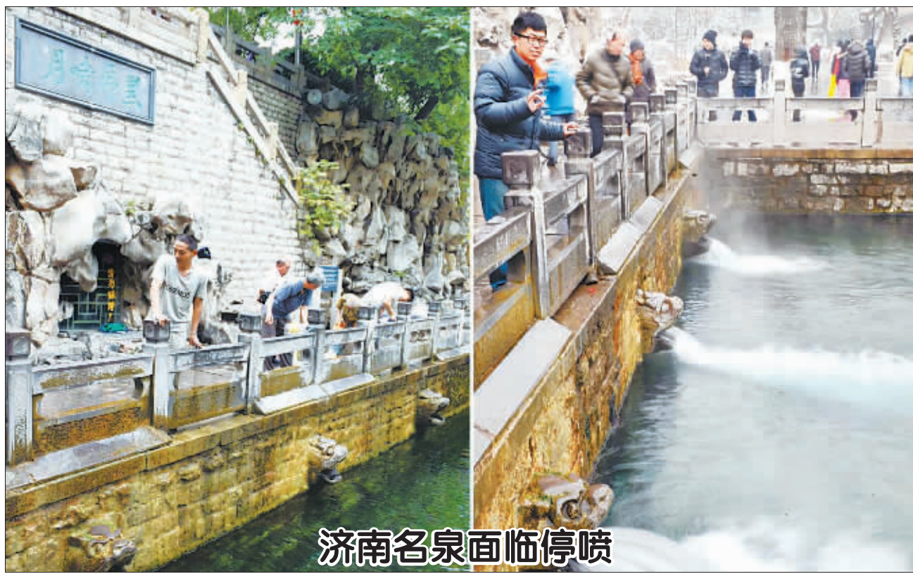
近日,受降水偏少和高温天气影响,济南地下水持续下降,趵突泉等济南名泉水位连创新低后,面临停喷的“生死”考验。趵突泉