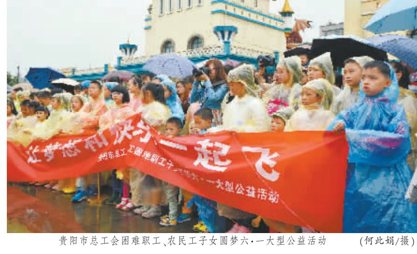
贵阳市总工会困难职工、农民工子女圆梦六一大型公益活动

贵阳市各级工会组织在客运站发放方便面、饼干、蛋糕等食品饮料等食品8000余件,晕车药、感冒药等常见药品3000余盒,为被盗、遗失财物、困难的农民工购买了返乡车票124张。此外,为了给返乡人员提供更安全、周到、人性化的服务,贵阳市总工会还拨付给金阳客运站3万元,用于客运站站务设施的改善。