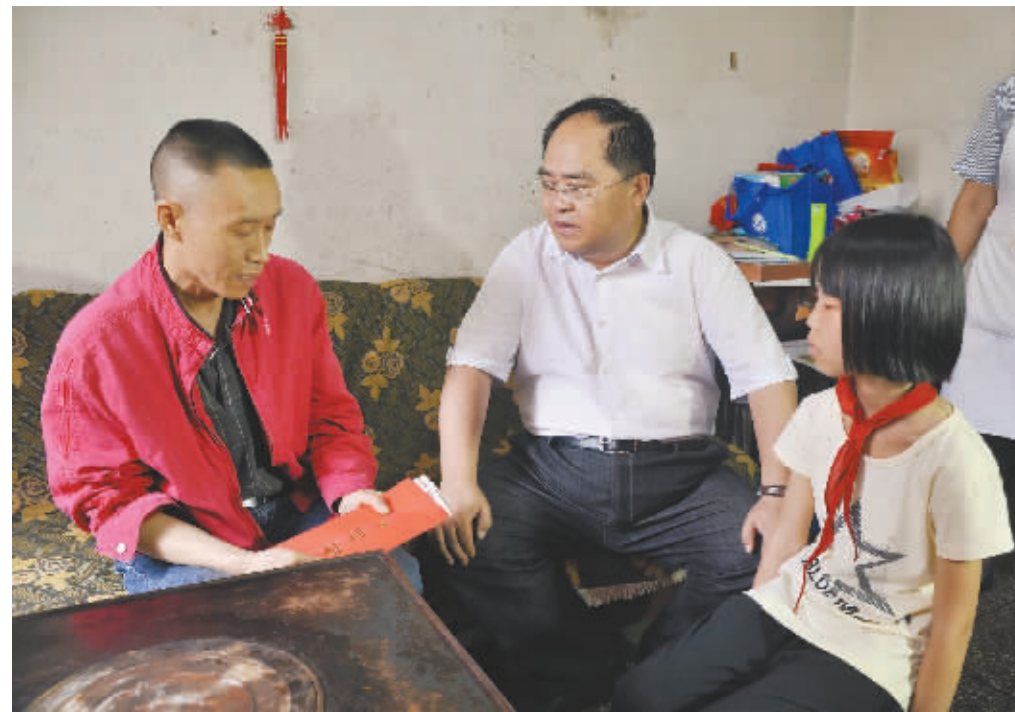
2015年5月29日,贵阳市人大常委会副主任、市总工会主席李志鹏慰问困难职工家庭