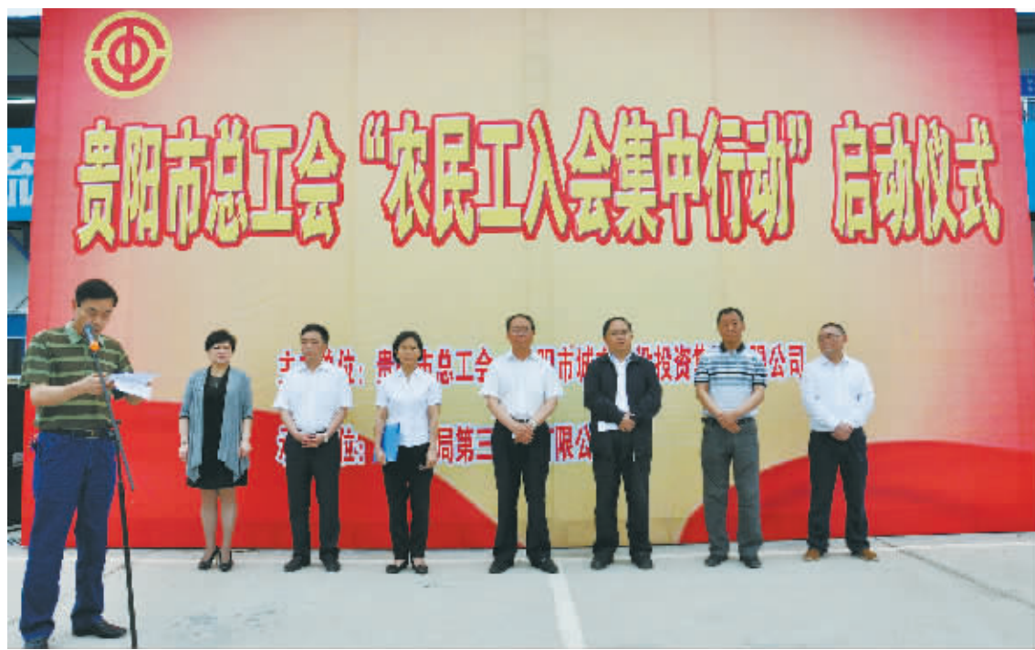
贵阳市总工会“农民工入会集中行动”启动仪式

2014年12月份,在成功召开的贵阳市工会第十五次代表大会上,市人大常委副主任、市总工会主席李志鹏表示,今后的5年,市总面临着发展的大好机遇,工会工作大有可为。市总要时刻用广大职工群众的期盼来鞭策自己,按照市委和省总的要求,恪尽职守,奋发有为,坚持一流工作标准,全面履行工会职能,以着力打造“五大品牌”,奋力实现“五大突破”为总抓手,进一步增强工会组织凝聚力、影响力,扎实推动贵阳市工会工作上质量、上水平、上台阶,不断开创具有鲜明时代特征、体现贵阳发展特色的工会工作新局面。