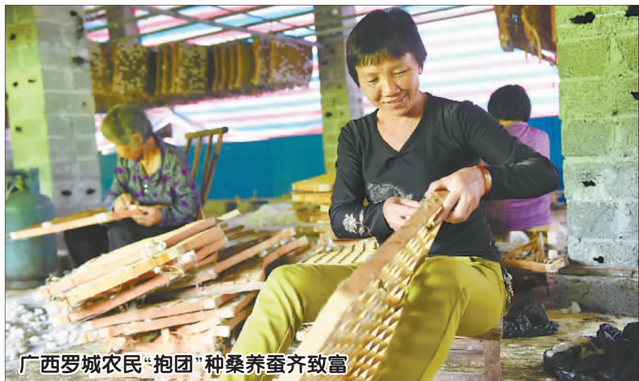
广西罗城农民“抱团”种桑养蚕齐致富

在工业生产者出厂价格指数方面,环比降幅收窄。5月份,PPI环比下降0.1%,降幅比上月收窄0.2个百分点。根据国家统计局分析,这主要有两方面的原因,一是石油加工价格由降转升,由环比下降1.5%转为上涨3.6%;二是部分工业行业价格涨幅扩大,石油和天然气、有色金属冶炼和压延加工、化学原料和化学制品出厂价格环比上涨4.4%、1.1%和0.7%,比上月涨幅分别扩大3.2个、0.6个和0.2个百分点。