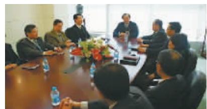
公司安全生产委员会定期组织召开安全生产会议,布置安全生产工作,解决安全生产问题。

该公司在安全生产、消防安全、职业健康卫生等方面舍得投入,对安全需要的资金优先保证,并逐年加大安全应急设施投入。近年来陆续配备了移动式消防泵、消防隔热服、SCBA呼吸器、二氧化碳自动灭火系统、氮气自动切断系统等设施和应急救援工具。针对