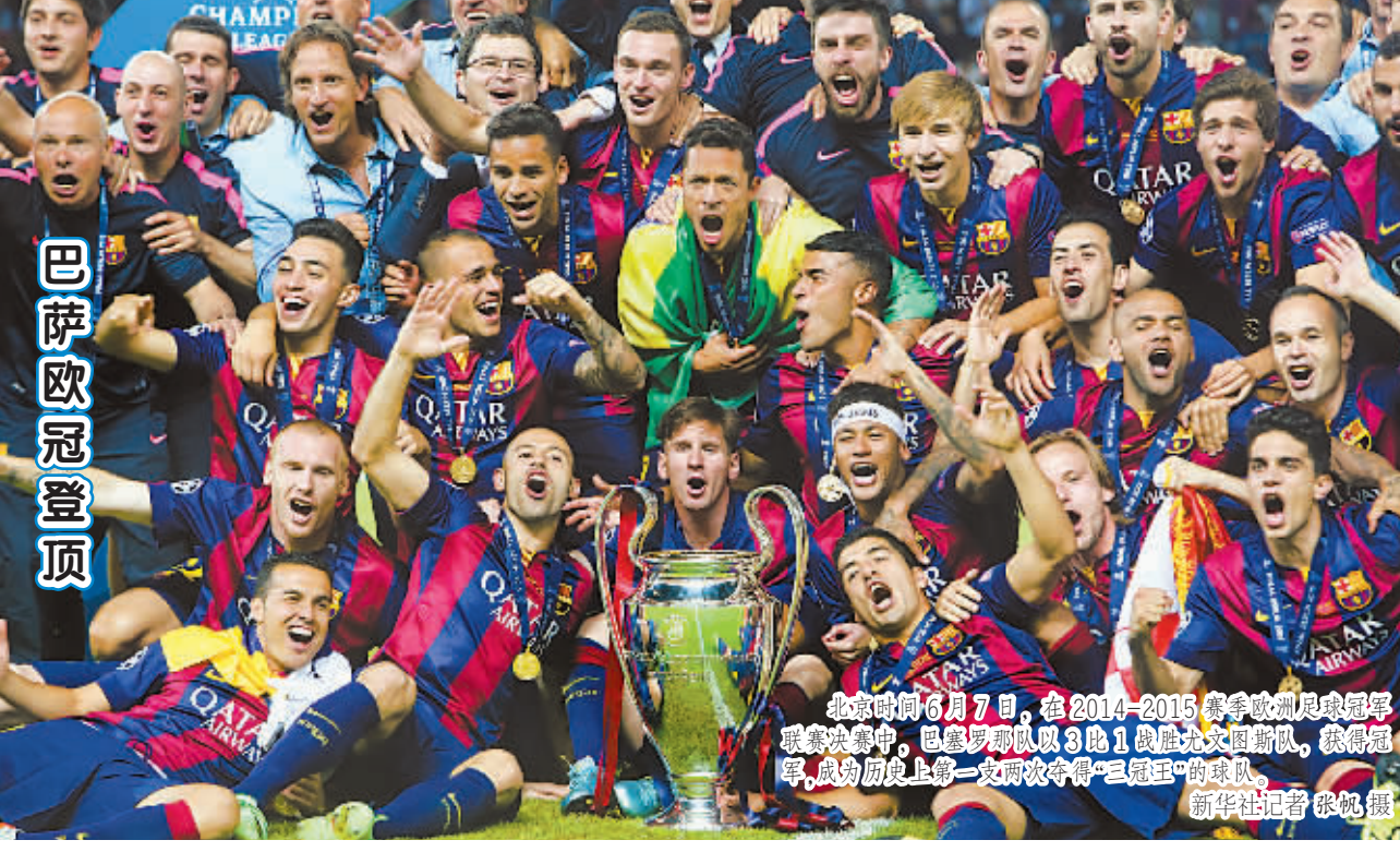
北京时间6月7日,在2014-2015赛季欧洲足球冠军联赛中,巴塞罗那队以3比1战胜尤文图斯队,获得冠军,成为历史上第一支两次夺得“欧冠王”的球队。