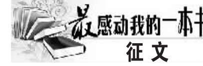
最感动我的一本书 征文

《一个人的村庄》的意义,并不限于文字本身的诗意之美,更在于作者对于土地的爱,对于简单生活的深刻思考。台湾岛的这座村庄,并非只有他一个人,更非他一人所拥有。然而,他可能是唯一细致观察它、感受它的体温和脉动,并思考它的未来的人。他或许就是书中写到的那只孤独的鸟,在那样一个闭塞