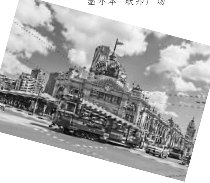
墨尔本-弗林德斯火车站