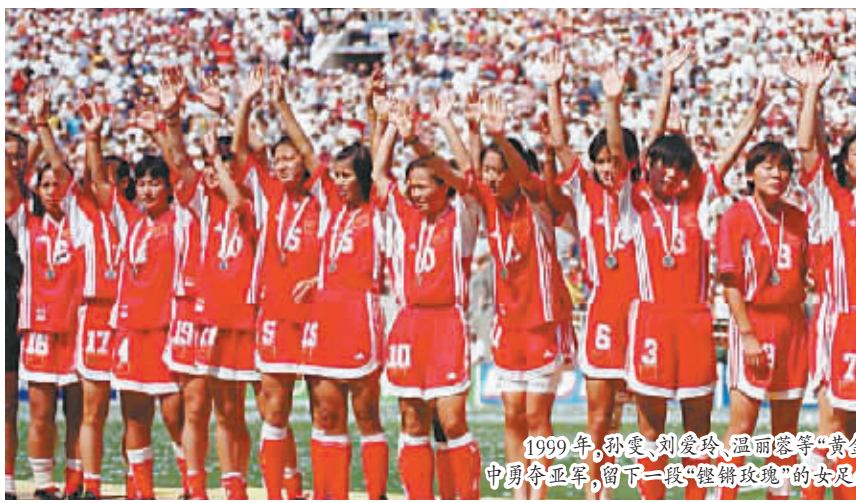
1999年,孙雯、刘爱玲、温丽蓉等“黄金一代”领衔的中国女足在第3届女足世界杯中勇夺亚军,留下一段“铿锵玫瑰”的女足佳话。

作为首届女足世界杯的东道主,中国女足在世界女足运动的发展过程中一直占据着重要地位,在前5届世界杯中无一缺席。特别是在1999年,孙雯、刘爱玲、温丽蓉等“黄金一代”领衔的中国女足在第3届女足世界杯中勇夺亚军,留下一段“铿锵玫瑰”的女足佳话。