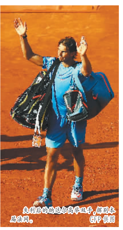
失利后的纳达尔高举双手,挥别本届法网。

相对于美德两强,近两届世界杯表现抢眼的巴西和日本女足同样不容忽视,尤其是上届世界杯一鸣惊人捧杯而归的日本女足。虽然日巴两队均受到阵容老化、近期状态起伏等不利因素的影响,但两支强队的底蕴犹在。