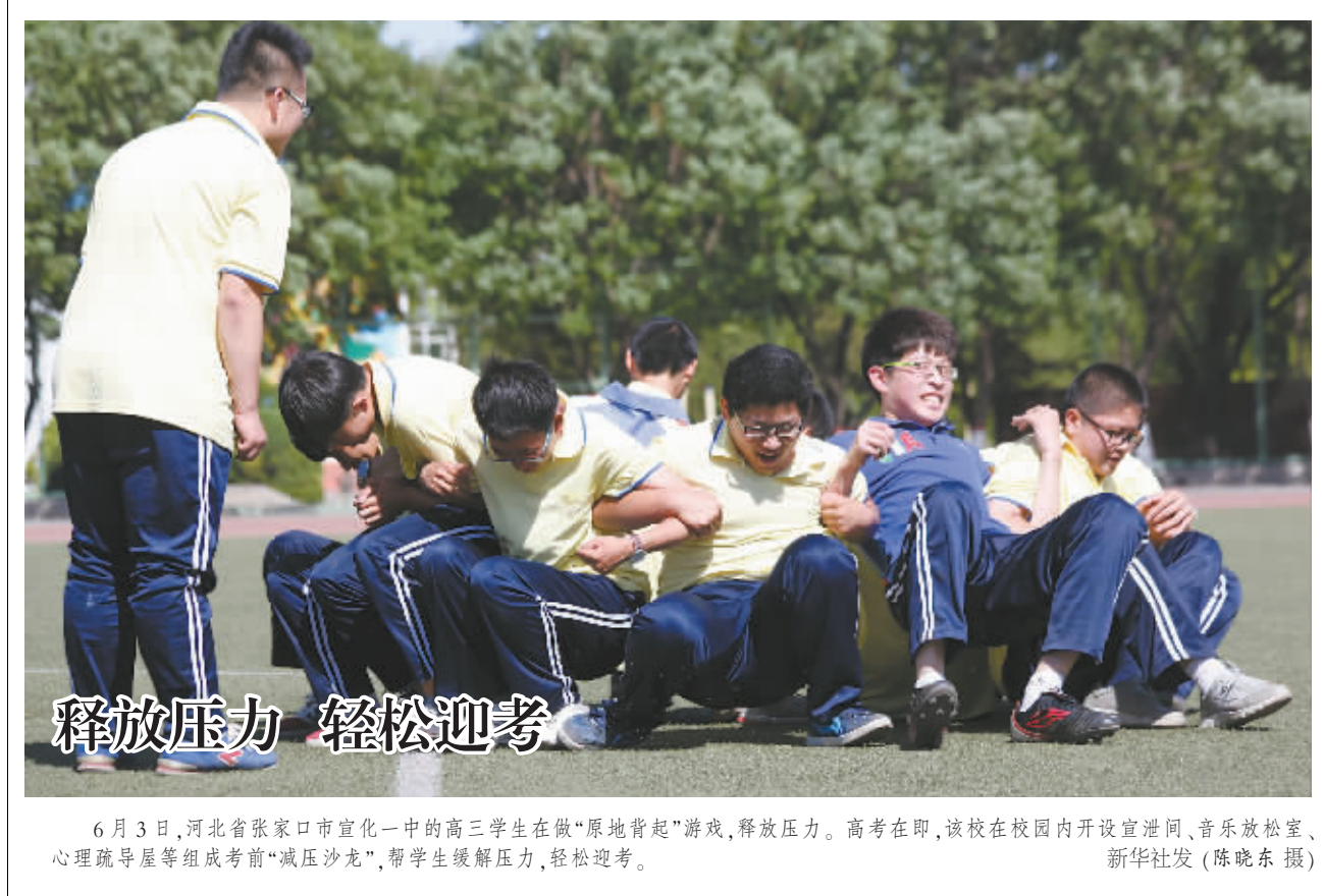
6月3日,河北省张家口市宣化一中的高三学生在做“原地背起”游戏,释放压力。高考在即,该校在校园内开设宣泄间、音乐放松室、心理疏导屋等组成考前“减压沙龙”,帮学生缓解压力,轻松迎考。

有没落必然有革新,在杭州,意在促使学生和企业“亲密接触”的移动互联网创新就业模式悄然兴起,他们将目光瞄准学生的就业服务,正在努力实现借助互联网平台帮助大学生就业的愿望,让用人单位和学生通过微信服务平台等网络新媒体反映真实需求,展示自我、发布各类信息,而后通过平台获取的数据,分析学生和企业的需求,有针对性地提供线上线下相结合的服务。