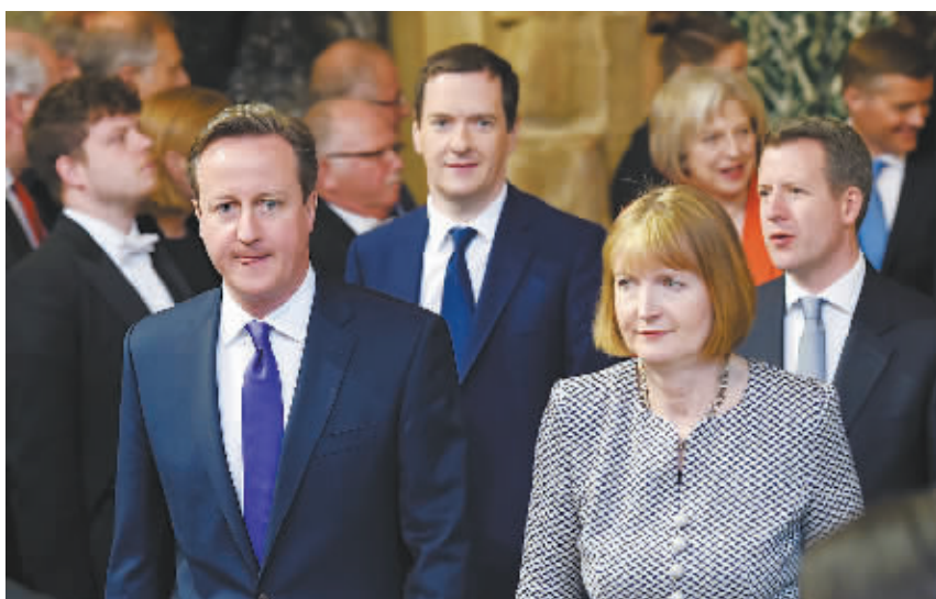
当地时间 5 月 27 日,英国伦敦议会大厦,英国首相卡梅伦(前左)和工党执行领袖哈里特·哈曼(前右)出席英国女王演讲。

英国女王伊丽莎白二世 27 日在英国议会发表演讲,开启新一届议会会期。女王在讲话中表示,英国将在 2017 年年底之前就是否脱离欧盟举行公投。而在女王讲话的次日,英国政府将向议会提交一份《欧盟公投法案》,对公投的步骤、流程和投票资格做出详细规定。