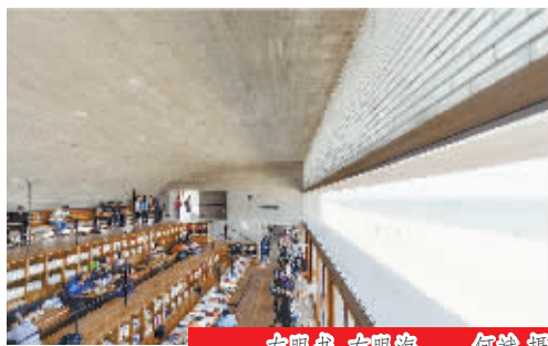
左眼书，右眼海。