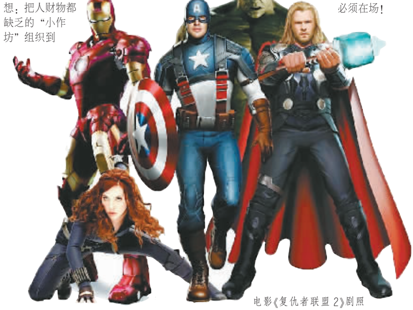
电影《复仇者联盟2》剧照

作为财富的象征,马云可能还是改变世界的头领。疑问是,意气风发的后来者,追寻的是财富光环还是背后的故事?很多人认为是网络,是现代科技成就了阿里巴巴,马云不这样看。他说自己不懂电脑,是科技文盲,有的仅是一个梦想:把人财物都缺乏的“小作坊”组织到