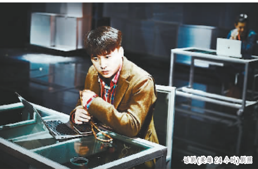
话剧《英雄24小时》剧照