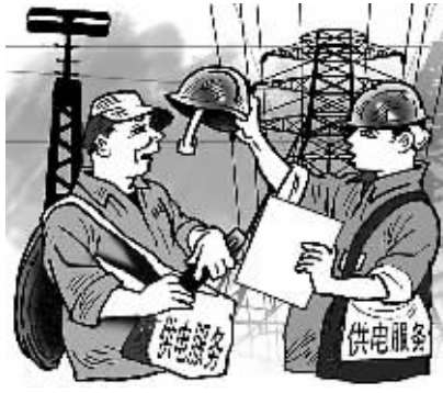
严守规章 党员带头 法明/画

公开曝光只能当做辅助手段和短期行为,从长远看,还是要回归管理和习惯的养成。曝光,只是手段,目的是促进整改,养成自觉的安全习惯。