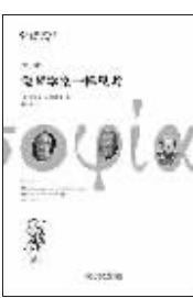
【美】詹姆斯·克里斯蒂安 著 赫志慧 译 北京大学出版社

美国加州圣安娜社区学院荣休教授、前哲学系主任、古希腊“整合哲学”理念的推广者詹姆斯·克里斯蒂安的这本书是畅销40余年的整合哲学入门书。本版为第11版,也是作者亲手修订的最终版。全书分8大部分33小章,举凡人类生活的方方面面,如天文、地理、自然、科学、生物、法律、历史、宗教、伦理、心理、社会、政治等无所不思,在迥然不同的人类思想领域之间串起一道内在联系之线。文中采用青少年喜闻乐见的方式,阐释他们在日常生活中迟早都会遇到的持久存在的问题。