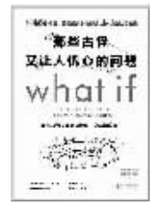
【美】兰道尔·门罗 著 朱君玺 译 北京联合出版公司

兰道尔·门罗曾在NASA工作,制造机器人。2006年成为全职网络漫画家,是美国最热门科普漫画网站xkcd的创立者。本书就是他的What if科普问答专栏合集。如果人体内的DNA瞬间消失了会怎样?如果把海水抽干会怎样?如果地球膨胀得像太阳一样大会怎样?牛排从多高的地方摔下来正好烤熟?全人类撤离地球需要几步?这不是中规中矩的《十万个为什么》,而是脑洞大开的科学真知,小时候萌生的异想天开,而一切都可以在这本书里找到最机智幽默的科学答案。